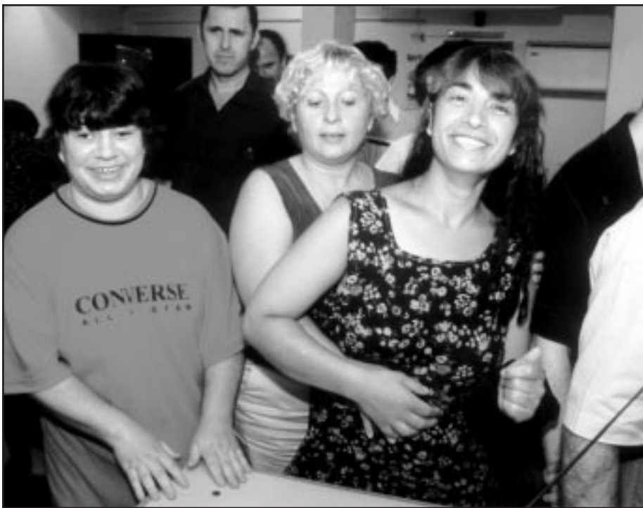
תמונות מתוך החזרות. "מצליחים להביע את הניואנסים הכי עדינים".